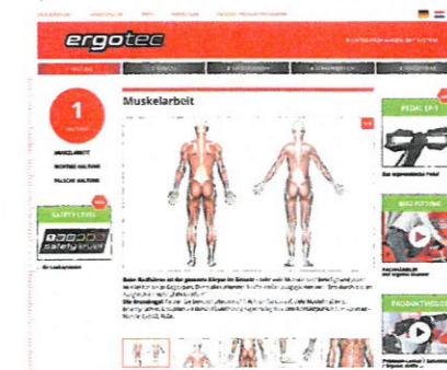
Wichtige Tipps gibt es auf www.RichtigRadfahren.de

diesen Ausgleich entsteht „Fahrkomfort“. Sein Rat: „Nehmen Sie sich bewusst Zeit, um Ihr Fahrrad richtig einzustellen.