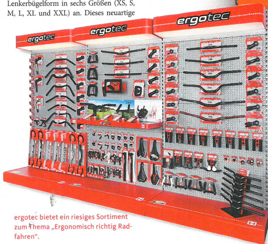
ergotec bietet ein riesiges Sortiment zum Thema „Ergonomisch richtig Radfahren“.

Konzept schafft die Möglichkeit, ähnlich wie beim Rahmen, die Breite entsprechend der Körperstatur zu wählen. Bei der Entwicklung des neuen SWELL-XR Vorbaus wurden die derzeitigen fertigungstechnischen Möglichkeiten voll ausgeschöpft. Was dabei herauskam, ist ein absolutes Highlight in Sachen Form, Stabilität und Gewicht. Das expressive X-Design mit seinen CNC-gefrästen Aussparungen machen den SWELL-XR Vorbau zu einem einzigartigen, unverwechselbaren Schmuckstück. Die innovative Winkelverstellung ermöglicht, die Griffhöhe und somit die Sitzposition von komfortabel bis sportlich frei einzustellen.