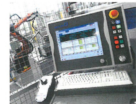
ergotec setzt auf hochwertige Produktion.

Trittfläche an die Fußsohle an und sorgt damit für eine optimale Kraftübertragung. Während der Fuß bei herkömmlichen Pedalen nur punktuell aufliegt und auf Grund der kurzen Pedaloberfläche in Längsrichtung verformt wird, unterstützt das EP-1 mit seiner sehr großen Kontaktfläche die Fußsohle. Beschwerden wie Taubheitsgefühle oder Fußschmerzen können gar nicht erst auftreten. Auf der großen, ana-