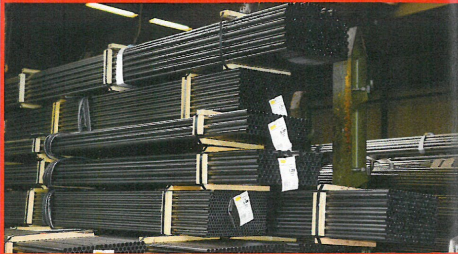
Vom Rohstoff ...